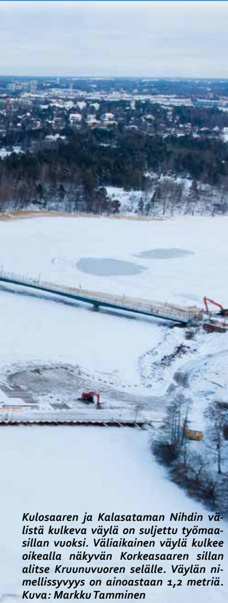
Kulosaaren ja Kalasataman Nihdin välistä kulkeva väylä on suljettu työmaasillan vuoksi. Väliaikainen väylä kulkee oikealla näkyvän Korkeasaaren sillan alitse Kruunuvuoren selälle. Väylän nimellisyvyys on ainoastaan 1,2 metriä.